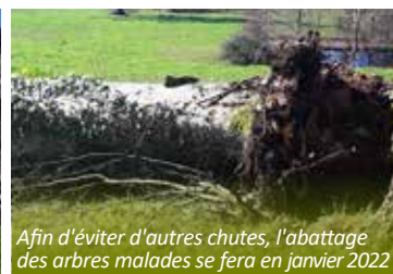
Afin d'éviter d'autres chutes, l'abattage des arbres malades se fera en janvier 2022