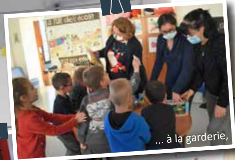
... à la garderie,