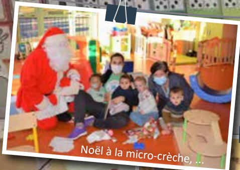
Noël à la micro-crèche, ...