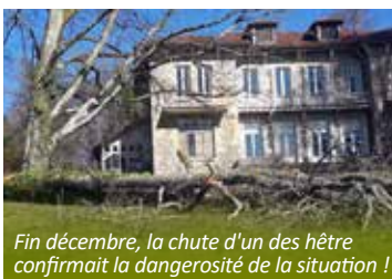
Fin décembre, la chute d'un des hêtres confirmait la dangerosité de la situation !

Bien sûr nous allons replanter, nous demandons conseil à l'ONF pour le choix des essences adaptées au changement climatique, mais ce n'est pas demain que le parc retrouvera sa splendeur.