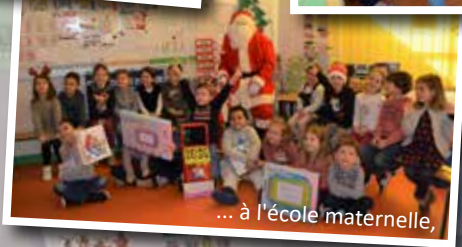
... à l'école maternelle,