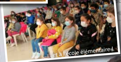
... et à l'école élémentaire !