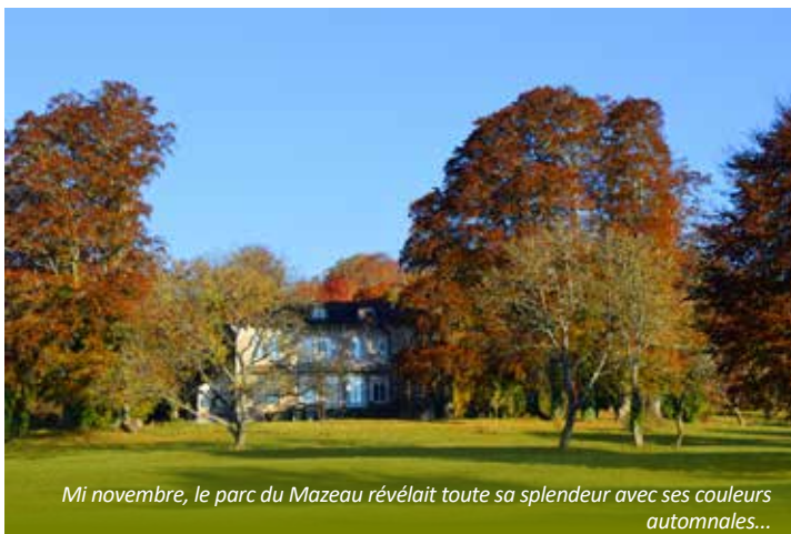
Mi novembre, le parc du Mazeau révélait toute sa splendeur avec ses couleurs automnales...