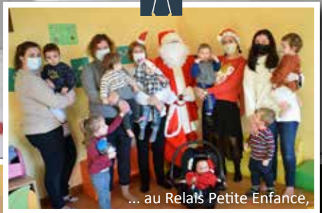
... au Relais Petite Enfance,