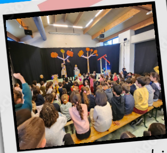
Spectacle école élémentaire